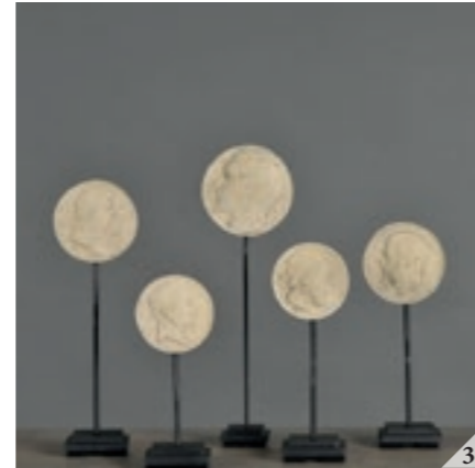
3/ SET DE 5 MÉDAILLONS XIX ÈME De H 14,5 x 5 x 5 cm à H 24,5 x 4 x 4 cm - ref. OD978 3/ SET OF 5 19 TH CENTURY MEDALLIONS From H 5,71 x 1,97 x 1,97 inches to H 9,65 x 1,57 x 1,57 inches - ref. OD978